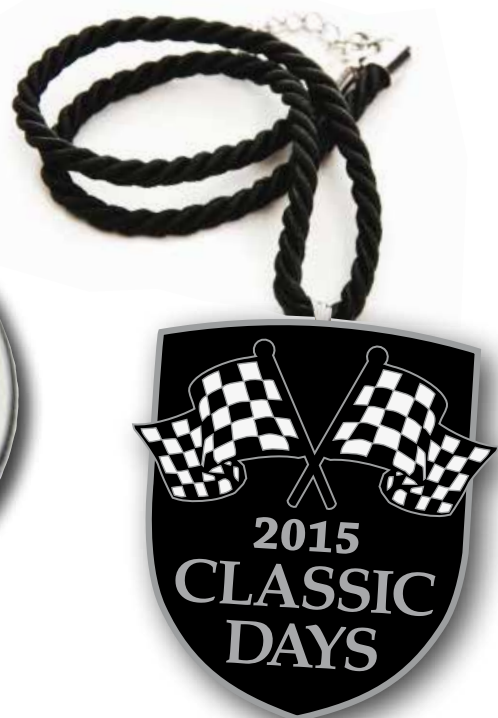
Beispiel: Jahres Badge aus Emaille Darstellung in Originalgröße (Grundfarbe variiert von Jahr zu Jahr)