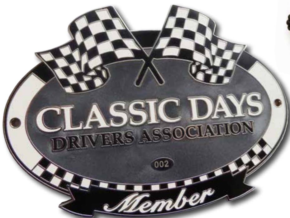
Nummeriertes Mitglieds-Badge (emailliert) Originalgröße

Mitglieder sind auch: Sir Stirling Moss, Hans Herrmann und Jochen Mass.